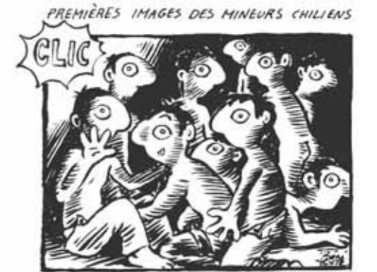
LES MINEURS CHILIENS DEVRAIENT SORTIR POUR NOËL.