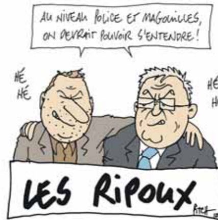
AFFAIRE HAINARD VS AFFAIRE THEUBET: NEUCHÂTEL ET LE JURA MÈTS POUR UN GRAND CANTON