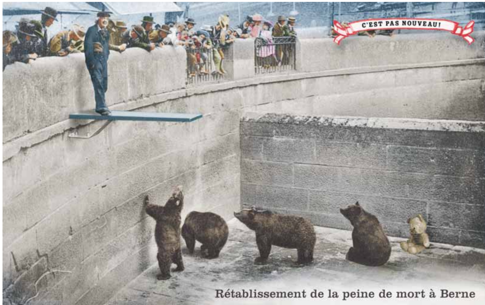
PLONK & REPLONK