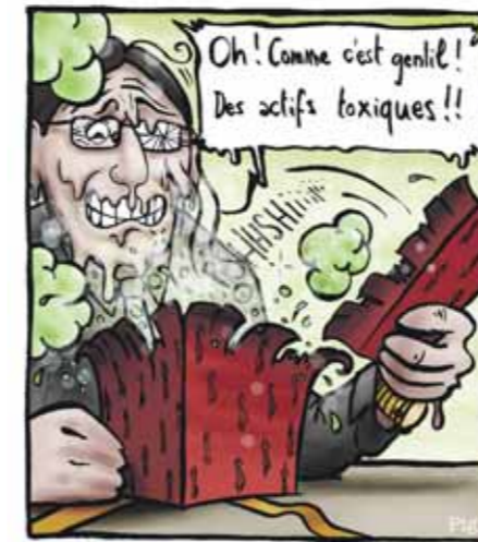
Des banquiers suisses reçoivent des colis piégés à l'acide sulfurique